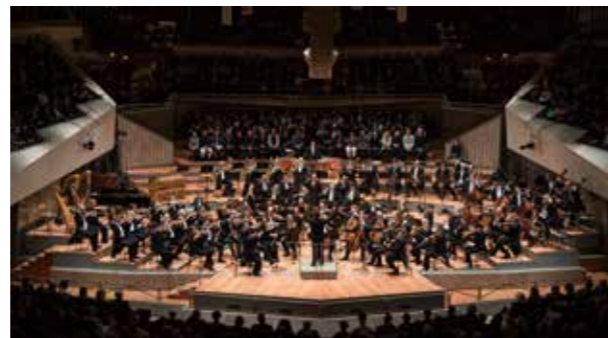
Berliner Philharmoniker / Sat. 22 November, 3:00p.m. TBD