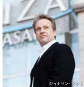
ジョナサン・ノット