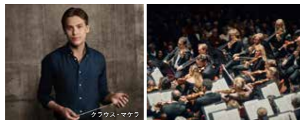
Royal Concertgebouw Orchestra / Sun. 16 November, 5:00p.m. Klaus Mäkelä (RCO Chief Conductor Designate), Conductor R. Strauss: "Don Juan", op. 20 Mahler: Symphony No. 5 in C-sharp minor

ミュゼ友の会 会員限定 2公演 セット券 11/16 ロイヤル・コンサートヘボウ管弦楽団、11/22 ベルリン・フィルハーモニー管弦楽団 発売日|3月18日(火)~3月22日(土) チケット|調整中