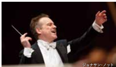
ジョナサン・ノット