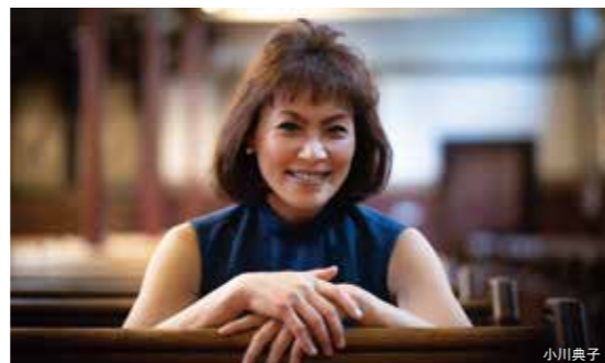
Noriko Ogawa Piano Recital « Beethoven, Brahms, Bartók », Produced by Noriko Ogawa Sat. 28 February 2026, 2:00p.m. Noriko Ogawa, Piano

チケット|全席指定 一般 ¥4,000 ¥1,500 発売日|友の会先行 10/7(火) Web先行 10/10(金) 一般 10/16(木)