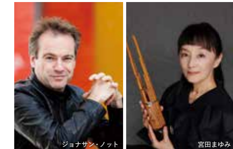
ジョナサン・ノット