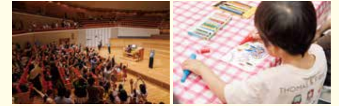
MUZA Kid's Festival 2025 Spring Children's Day Open House Mon. 5 May Pipe Organ Mini Concert Pipe Organ Lessons Students Concert etc. * Free admission. * All events are available for babies.