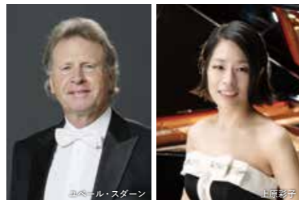
ユベール・スダーン

#209 / Sat. 5 July, 2:00p.m. Hubert Soudant (TSO Conductor Laureate), Conductor Ayako Uehara, Piano Berlioz: Overture "Le Carnaval Romain", op. 9 Ravel: Piano Concerto in G major Bizet: "L'Arlésienne" Suite No. 1 & No. 2