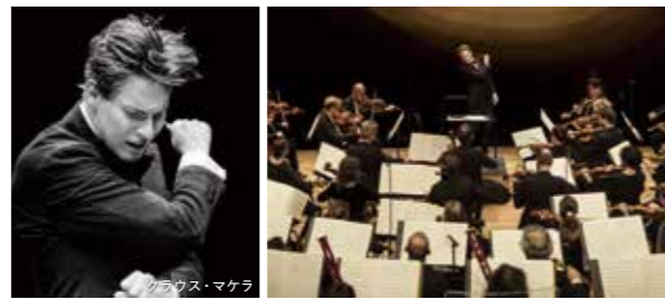
Orchestre de Paris / Wed. 18 June, 7:00p.m. Klaus Mäkelä (ODP Music Director), Conductor Saint-Saëns: Symphony No. 3 in C minor, op. 78, "Organ" Berlioz: Fantastic Symphony, op. 14

チケット|S ¥35,000 A ¥30,000 B ¥25,000 C ¥20,000 D ¥15,000 発売日|友の会先行1/21(火) Web先行1/24(金) 一般1/30(木)