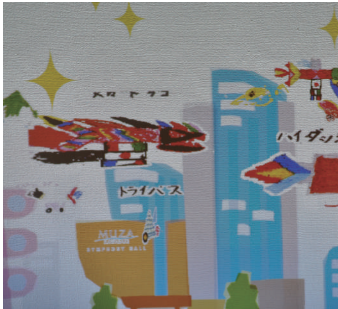
ぬりえが動き出す!