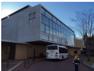
直行バスも藤子キャラクター仕様