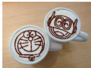
かわいいラテアート

サマーミュージックも終盤! フェスタが終わったら残りの夏休みをどう過ごそうか... 今日そんなアナタに川崎市のおすすめスポットをご紹介します。