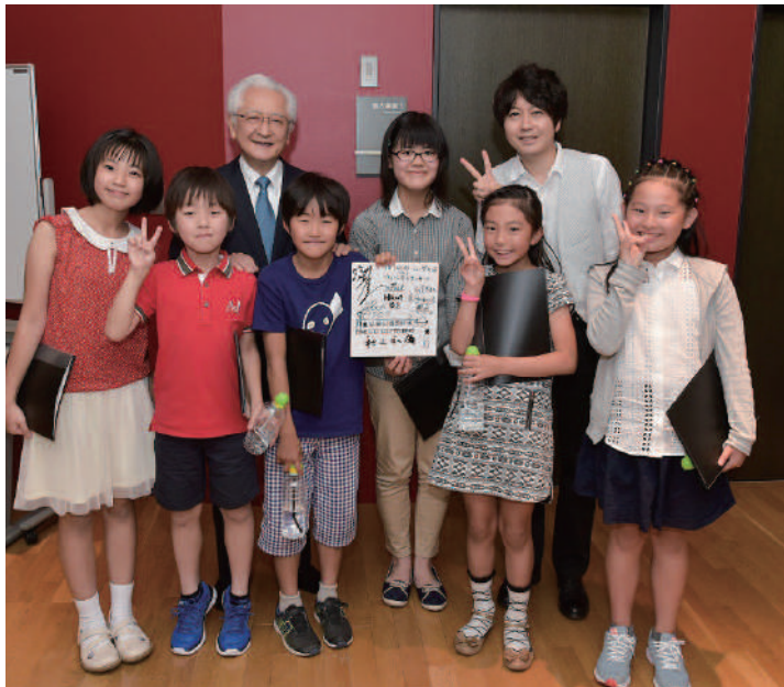
ミュージカの日ウェルカムコンサート 終演後、指揮者・秋山和慶さん、声優・堀江一真さんと朗読の子どもたち

7月1日はミュージカ川崎シンフォニーホールの開館記念日、川崎市の市制記念日でもあります。市内の小中学校がお休みとなるこの日、ミュージカは川崎駅西口を盛り上げるお祭りを開催。その名も「ミュージカの日」。3回目となる今年も、JR「トレインフェスタ」や「ものづくり体験」などイベントを多数実施し、1万人を超える人々が詰めかけました。