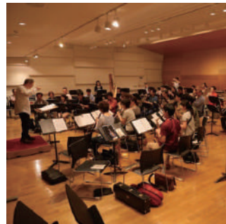
本日 (7/25) 11時スタートのオープニングファンファールの様子