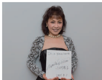
8月1日(土) イッツ・ア・ピアノワールド