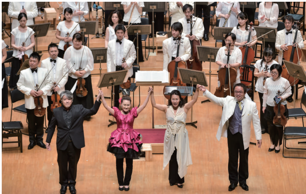
8月3日(月) 東京ニューシティ管弦楽団

劇伴と呼ばれる映画・芝居・ミュージカル・アニメ・ゲームなどの音楽は、クラシック音楽同様、確実に長く人の心に残る数々の名曲を生み出してきた。中でゲーム音楽は最近、交響曲として演奏されることが増えてきた。