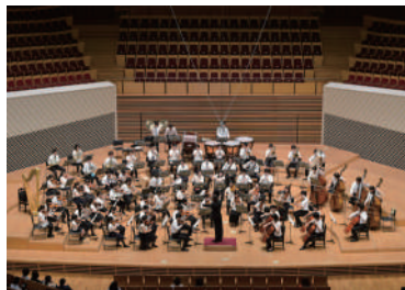
8月3日(月) かわさきジュニアオーケストラ発表会