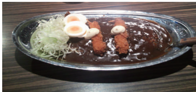
えびフライカレー(特典のトッピングはゆでたまごをセレクト)

金沢市を中心に食べられていて、スパイスの効いた濃厚なルーの上にカツをのせて付け合わせにキャベツ、ステンレスの皿でフォークで食べるのが金沢カレー。暑さで体調を崩しがちな