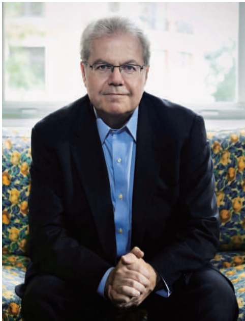
エマニュエル・アックス

この秋に始動する新企画「アーティスト in ミューザ」。世界的に著名な音楽家をミューザに招いて、リサイタル出演や、オーケストラと共演をしていただくほか、公開マスタークラスを開催するなど、その音楽家の音楽性と人となりにより焦点をあてる企画です。