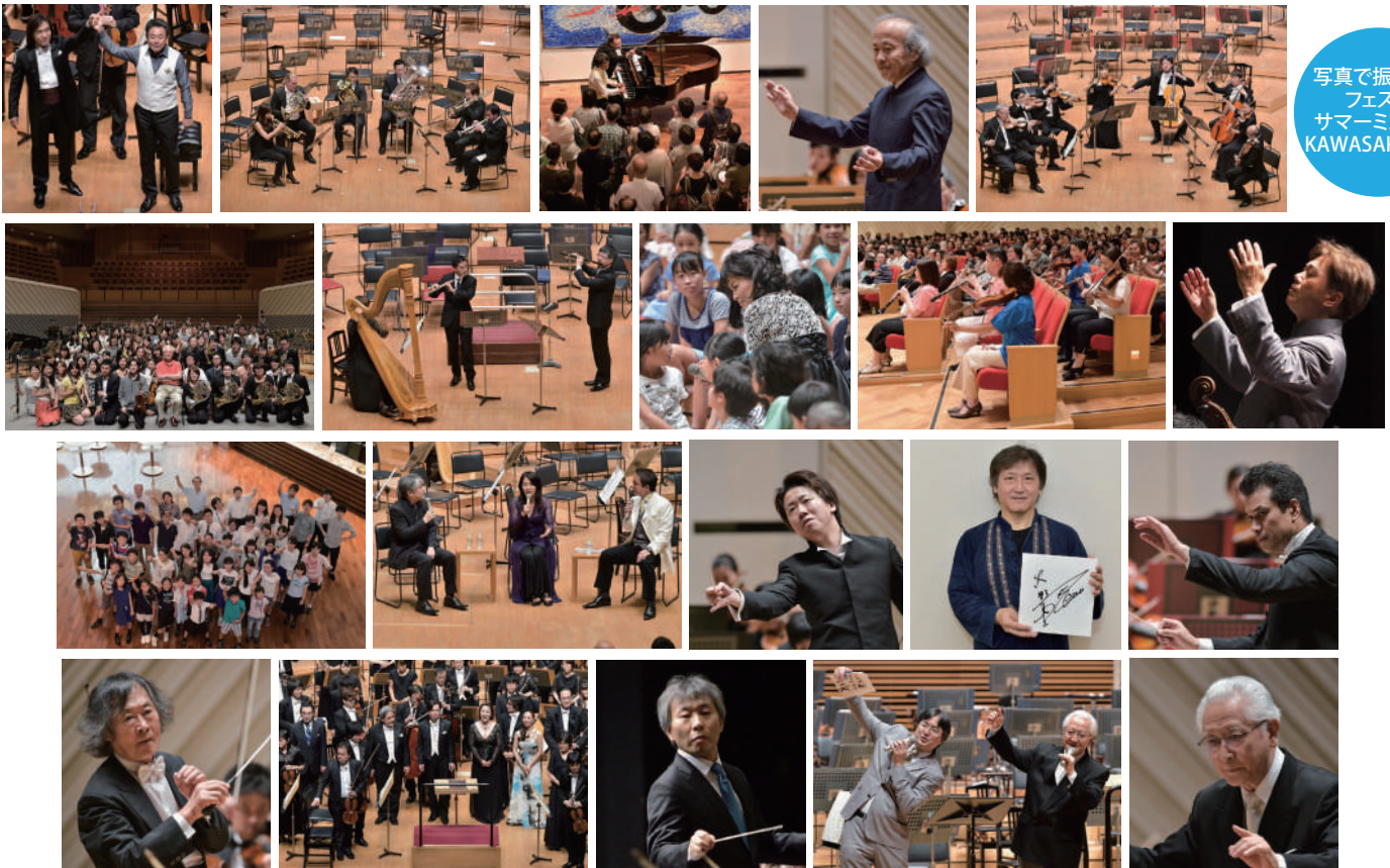
写真で振り返る フェスタ サマーミュージアム KAWASAKI 2015