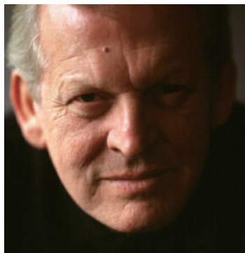
モーツァルト： 歌劇「コジ・ファン・トゥッテ」全2幕 演奏会形式・原語上演(日本語字幕付き) 指揮：ジョナサン・ノット(写真左) 舞台監修：サー・トーマス・アレン(写真上) 管弦楽：東京交響楽団