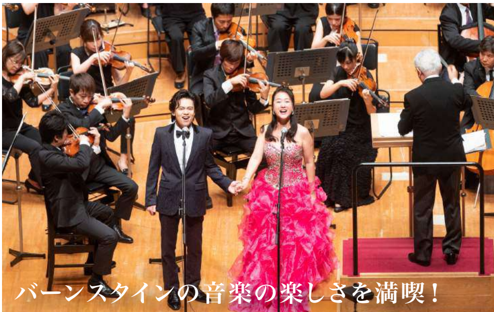
バーンスタインの音楽の楽しさを満喫!