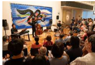
若手ミュージシャンのロビーコンサートも大盛況!