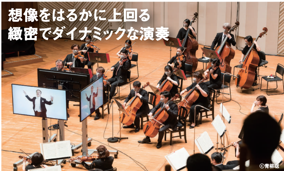
[7/23 東京交響楽団オーフニックコンサート]

今年も音楽ファン待望のサマーミュージアが始まった。新型コロナウイルスの影響で、出演者と曲目変更があり、入場者数も限定されるが、全17公演のライブ映像配信&8月末までのアーカイブ配信(有料)が行われるのはありがたい。