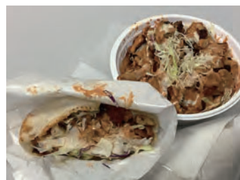
ケバブサンド500円、ケバブ丼500円