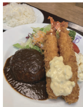
ハンバーグ&エビフライのランチ(1,000円)

子どもの頃に憧れた洋食のド定番メニューですが、名店の確かな技術でここまで高められると、「これってクラシック音楽と同じだよなー!」と実に感慨深し。