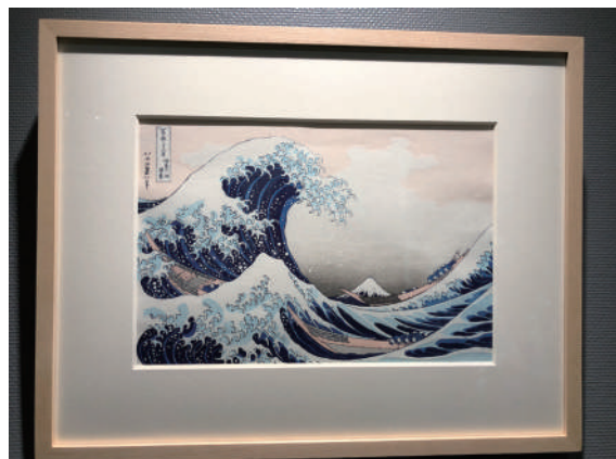
神奈川沖浪裏のレプリカは撮影も可能です

館内は撮影不可ですが、「神奈川沖浪裏」と赤い富士を描いた「凱風快晴」は撮影用のレプリカも展示されています。また、浮世絵のできる工程の展示もあり、自由研究にもぴったりです。ぜひ足を運ばれてみては。