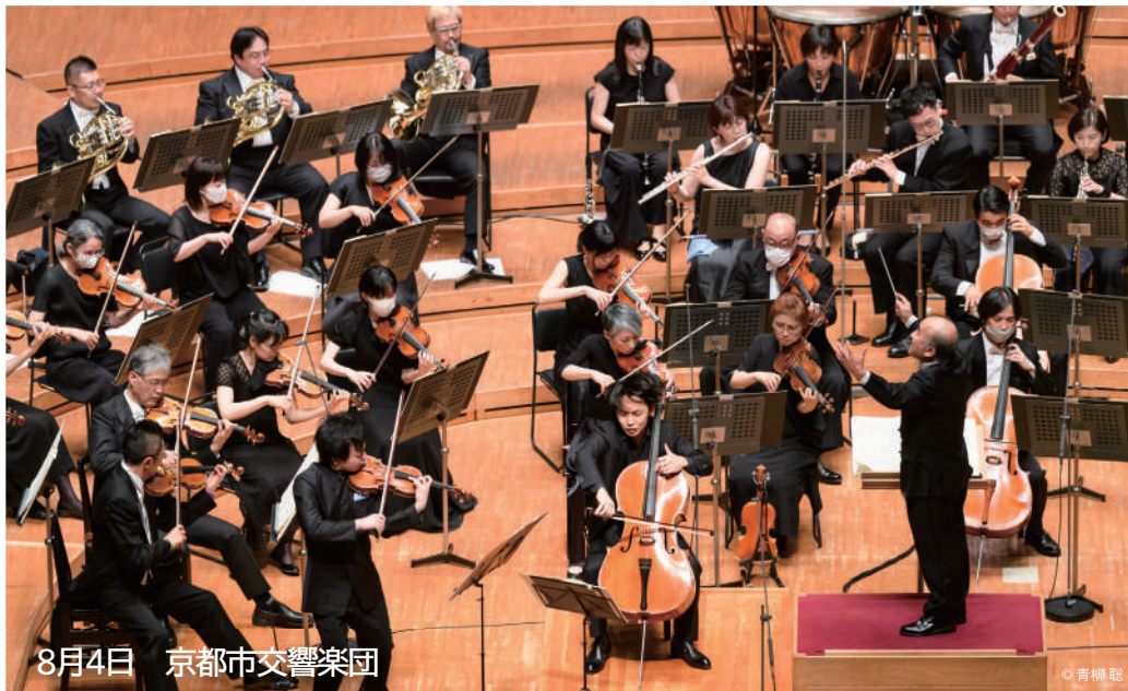
8月4日 京都市交響楽団