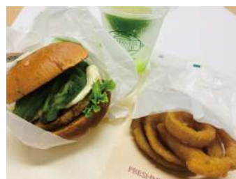
SOYアボカドバーガー 550円 プレミアムセット 490円 (オニオンリング+ライムソーダ)

せっかくなので最近話題の「大豆のお肉」のバーガーを試してみました。食感は完全に普通のパティと変わりません。クリーミーなアボカドと、あっさりめのソースで、べろりと平らげてしまいました。念願のオニオンリングもさっくりカリッ☆んー、そうそうこれこれ!! 美味しかったです。優待券を使えば10%OFFで、お財布にもうれしいですね。(奈)