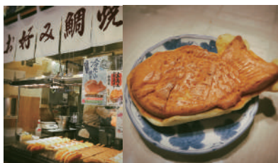
冷たい鯛焼き チョコ200円/レアチーズ200円/ シャインマスカット230円