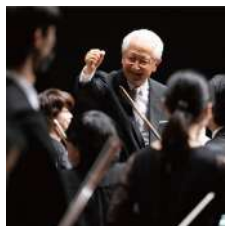
終演後のひとコマ