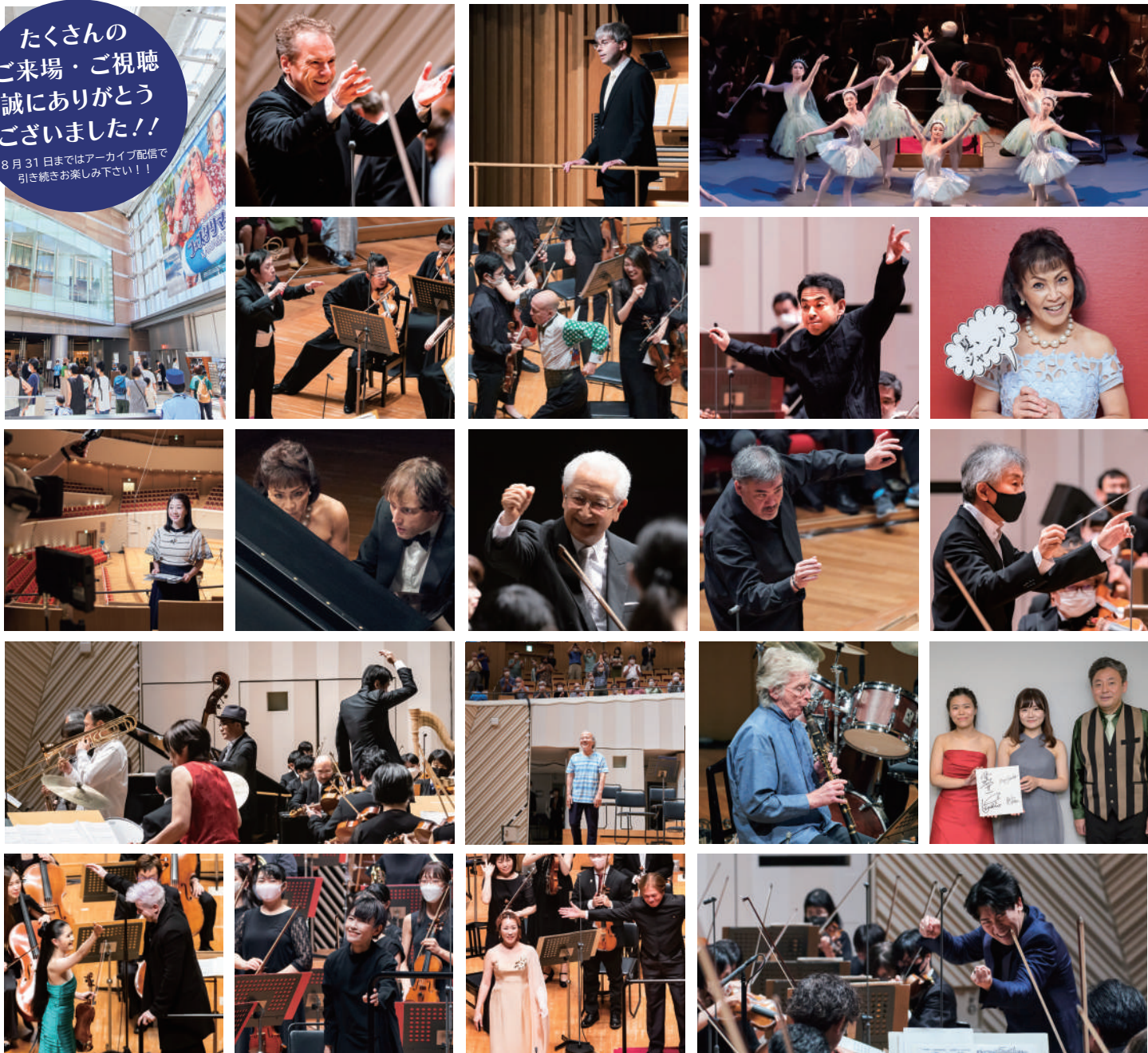
【左上から・敬称略】07/23 東京交響楽団 オープニングコンサート(ジョナサン・ノット) | 7/24 真夏のパッサ(ジャン=フィリップ・メルカールト) | 7/26 洗足学園音楽大学 | 7/28 神奈川フィルハーモニー管弦楽団(大橋英次、コンサートマスター石田泰尚) | 7/29 読売日本交響楽団(井上道義) | 7/30NHK交響楽団(下野竜也) | 7/31 どもフェスタ イッツ・ア・ピアノ・ワールド(小川典子) | 7/31 超絶技巧のロシアン・ピアノ・ピアニズム(イリヤ・ラシコフスキー、小川典子) | 7/31 出張サマーミュージック@しんゆり! 東京交響楽団(秋山和慶) | 8/2 東京都交響楽団(アラン・ギルバート) | 8/3 新日本フィルハーモニー交響楽団(梅田俊明) | 8/4 東京シティ・フィルハーモニック管弦楽団 | 8/5 大阪フィルハーモニー交響楽団(尾高忠明・ソロカーテンコール) | 8/6 サマーナイト・ジャズ(リチャード・ストルツマン) | 8/6 出張サマーミュージック@しんゆり! 神奈川フィルハーモニー管弦楽団(進藤実優、古海行子、横山幸雄) | 8/7 東京フィルハーモニー交響楽団(ダン・エッティングガー、服部百音) | 8/9 昭和音楽大学(田中祐子) | 8/10 日本フィルハーモニー交響楽団(現田茂夫、森谷真理) | 8/11 東京交響楽団 フィナーレコンサート(原田慶太楼) | 撮影:池上直哉(7/23、26、28、30、8/3、4、7、10) 平館平(7/24、29、31、8/2、5、6、9、11) 藤本史昭(しんゆり2公演)