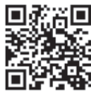
フェスタサマーミュージック公式サイト

来年のサマーミュージックの発表は、2023年3月頃を予定しております。ご期待ください！