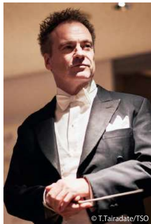
指揮：ジョナサン・ノット

【料金】 S席 ¥7,000 A席 ¥6,000 B席 ¥4,000 C席 ¥3,000 当日学生券 ¥1,000 (要問合せ)