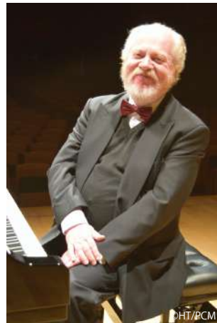
ピアノ：ゲルハルト・オピッツ