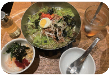
牛焼肉とたっぷり野菜冷麺セット (税込1,250円)