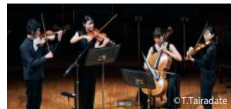
プレコンサートの様子