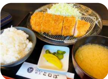
キャベツ、ご飯も味噌汁も地味に旨い