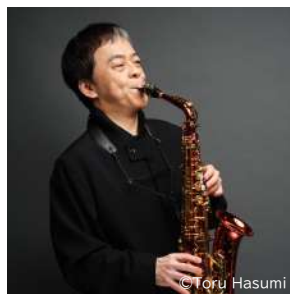
サクソフォン：須川展也★