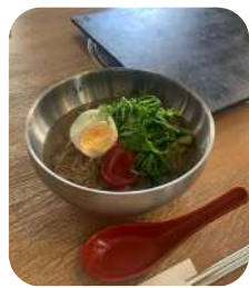
「梅しそ冷麺」 1,200円(税込み)

川崎駅から徒歩5分、チネチッタ通りにある「韓国料理 & BBQ ペゴッパヨ 川崎本店」に行ってきました。この日は猛暑日でしたので、迷わず「梅しそ冷麺」にしました。(こちらは 9/1までの夏限定メニューです。)