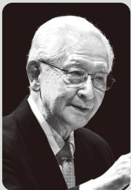
指揮 秋山和慶 (東京交響楽団桂冠指揮者)

クラシック音楽やオーケストラに触れると出てくるたくさんの疑問。気になるけれど、聞きづらい、知っているようで答えられない、そんな疑問をひとつひとつ、ひもといっていきます。クラシックはじめてのあなたには、オーケストラの「そうだったのか！」が、音楽が大好きなあなたには、その楽しさをだれかへ伝えるためのエッセンスが、ギュッと詰まった1時間になるはず。ぜひご家族3世代でお楽しみください。