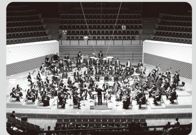
オーケストラ 東京交響楽団 (川崎市フランチャイズオーケストラ)